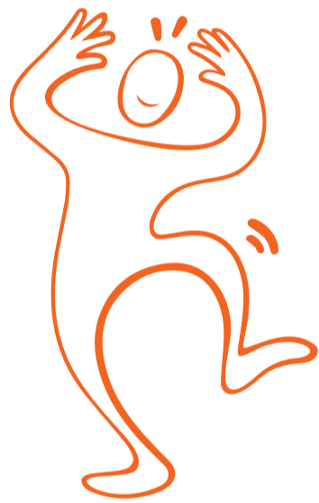
3. Stående sidoböj