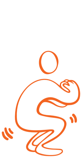
1. Knäböj med tålyft