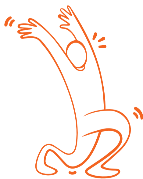
5. Utfall med armllyft